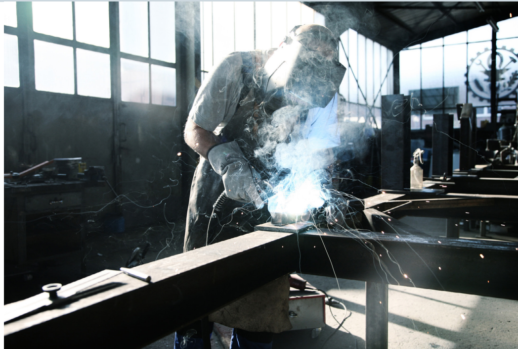
Die Schnittstelle ermöglicht Metallbaubetrieben eine ganzheitliche Lösung vom Verkauf bis zur Produktion.